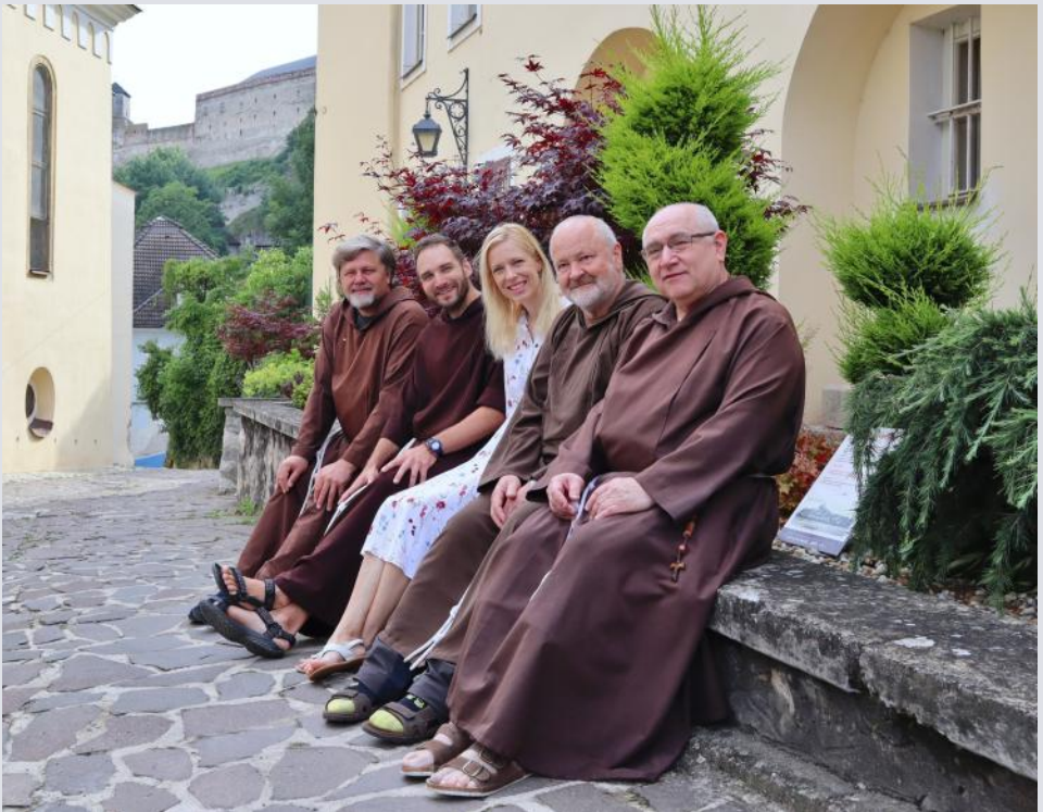
Ľudové misie, jún r. 2024, Trenčín