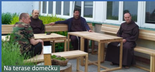
Na terase domečku