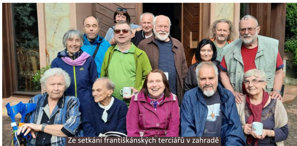
Ze setkání františkánských terciářů v zahradě